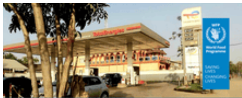
Rising Fuel Prices and Food Security in Cameroon: Overview and Outlook (WFP Cameroon, April 2024)